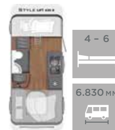
LIFT 430 K