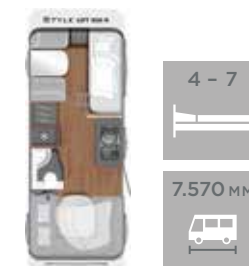
LIFT 500 K