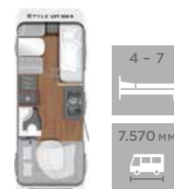
LIFT 500 K