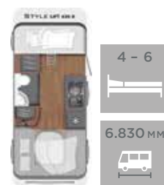
LIFT 430 K