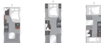
440 D SPECIAL EDITION